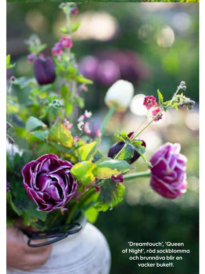
'Dreamtouch', 'Queen of Night', röd sockblomma och brunnäva blir en vacker buket.