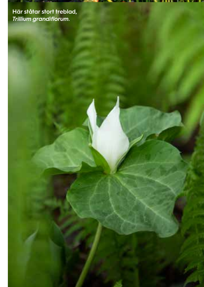
Här står stort treblad, Trillium grandiflorum .