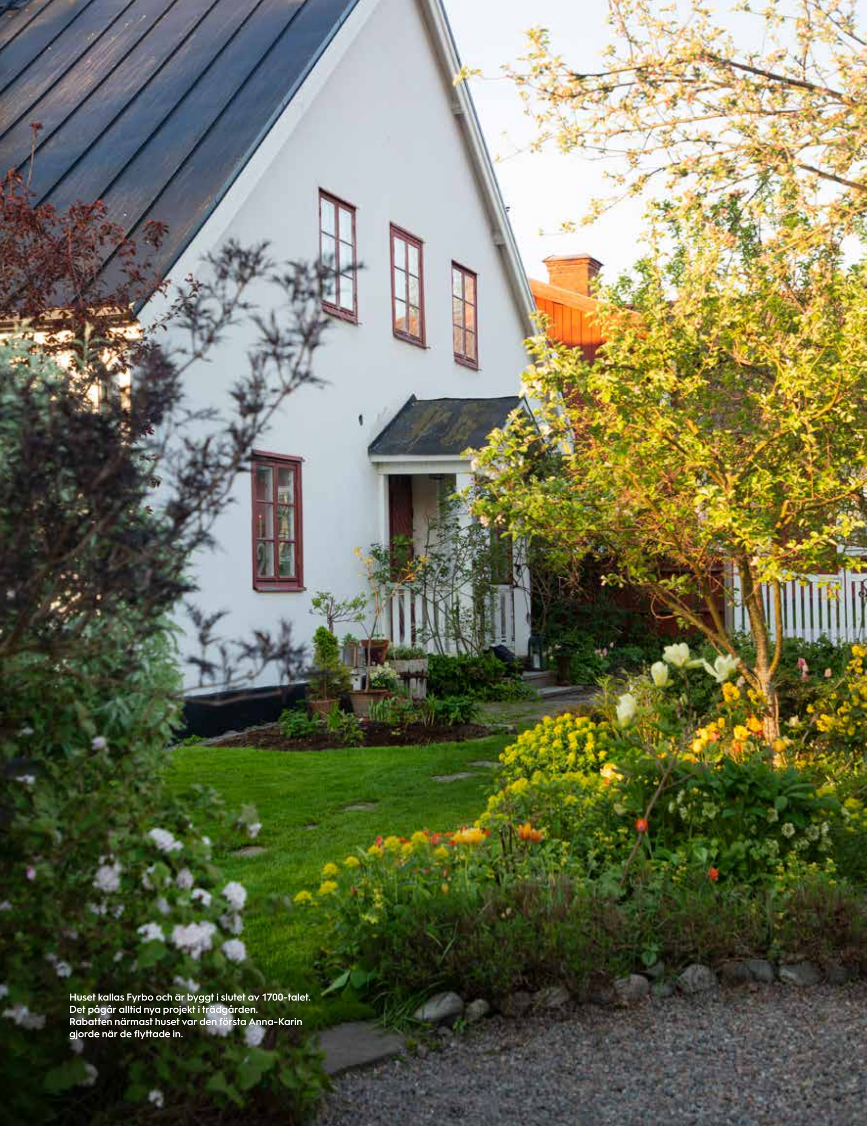
Huset kallas Fyrbo och är byggt i slutet av 1700-talet. Det pågår alltid nya projekt i trädgården. Rabatten närmast huset var den första Anna-Karin gjorde när de flyttade in.