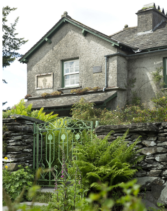
Lake District har många författarhem som man kan besöka, här barnboksförfattaren Beatrix Potters barndomshem Hill top.