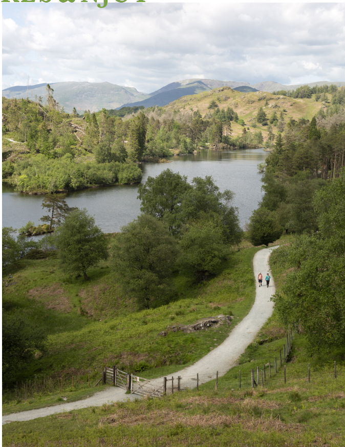
Alla vandrar i Lake District, det finns massvis av utmärkta leder med både enkla och svårare vandringar.