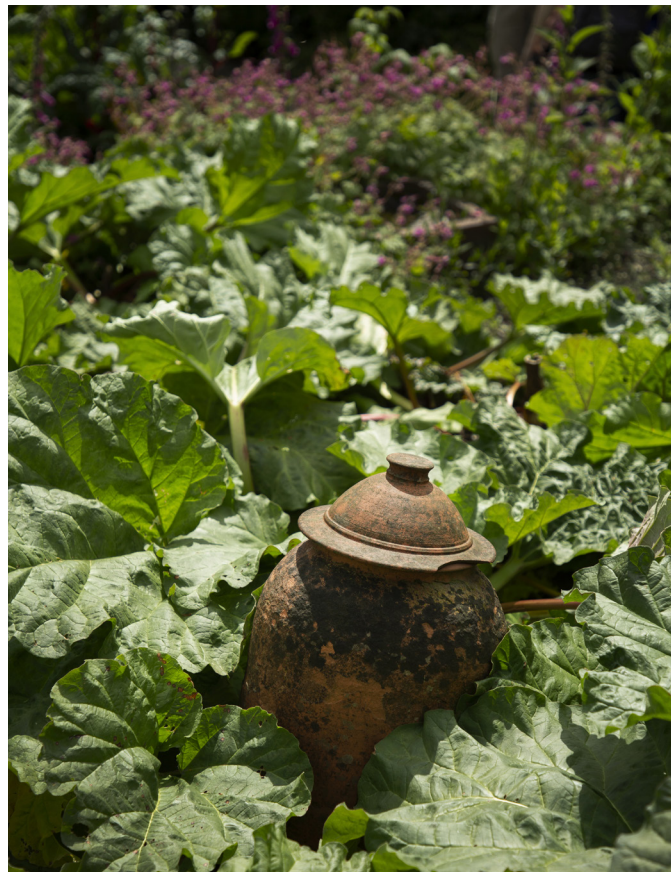
Rabarbern frodas i köksträdgården på Hill Top. Här odlade Beatrix Potter det mesta som hushållet behövde.

På helgerna kan man ofta hitta charmiga landsbygds-marknader där bondgårdsdjur bedöms och säljs.