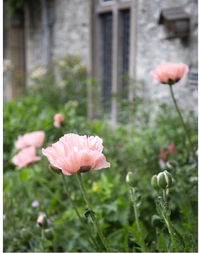
Var är bilden tagen?? Rosa vallmo?? xxx xxxxx xxxx xxx xx xxxxx xxxxx xxxxx xxxxx xxxxx xxxxx xxxxx xxxxx xxxxx.