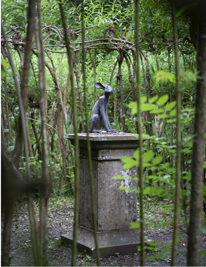
Längst in i trädgården på Levens Hall finns en bambuskog där statyer gömmer sig.