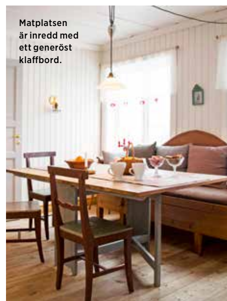
Matplatsen är inredd med ett generöst klaffbord.