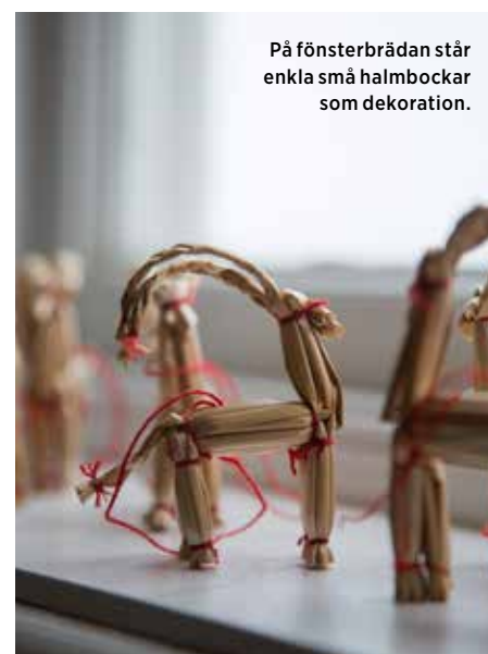
På fönsterbrädan står enkla små halmbockar som dekoration.

H älsingland är vida känt för sina vackra gårdar, inte minst eftersom några av dem är utnämnda till världsarv. Men det är inte bara de största och pampigaste gårdarna som berättar spännande historier – det gör förstås även torpen och smågårdarna. En av dem är Larses, en gård belägen bland skog och böljande fält i Arbråtrakten.