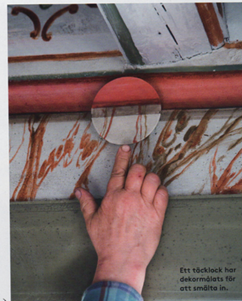
Ett täcklock har dekomålats för att smälta in.

– Jag har verkligen fått tänka till. Vad hade man på sig på 1600-talet, hur såg en hästsele ut då? Jag har letat i böcker och googlat för att få >