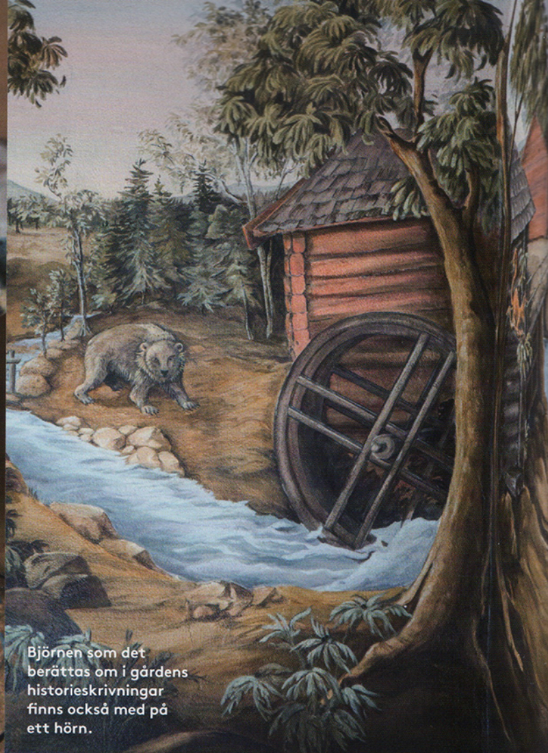
Björnen som det berättas om i gårdens historieskrivningar finns också med på ett hörn.