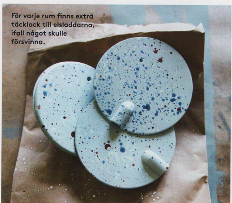
För varje rum finns extra täcklock till elsladdarna, ifall något skulle försvinna.