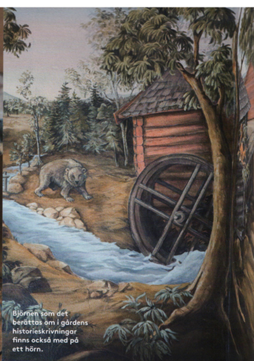
Björnen som det berättas om i gårdens historieskrivningar finns också med på ett hörn.