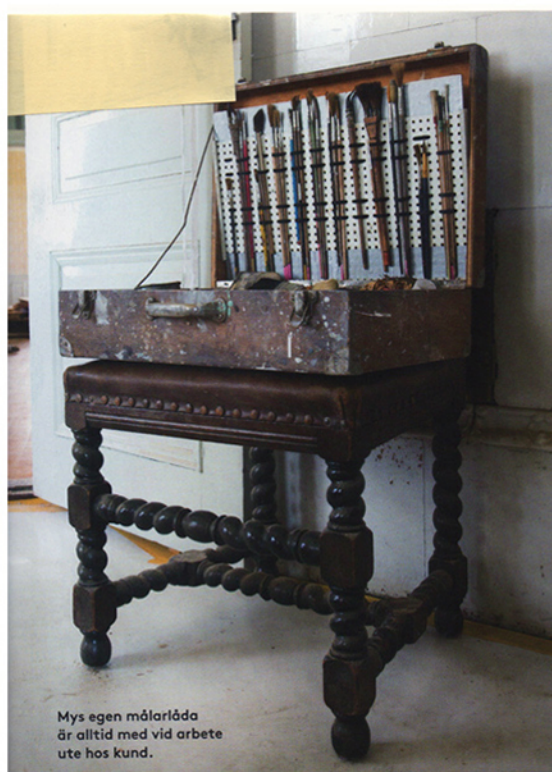
Mys egen målarlåda är alltid med vid arbete ute hos kund.