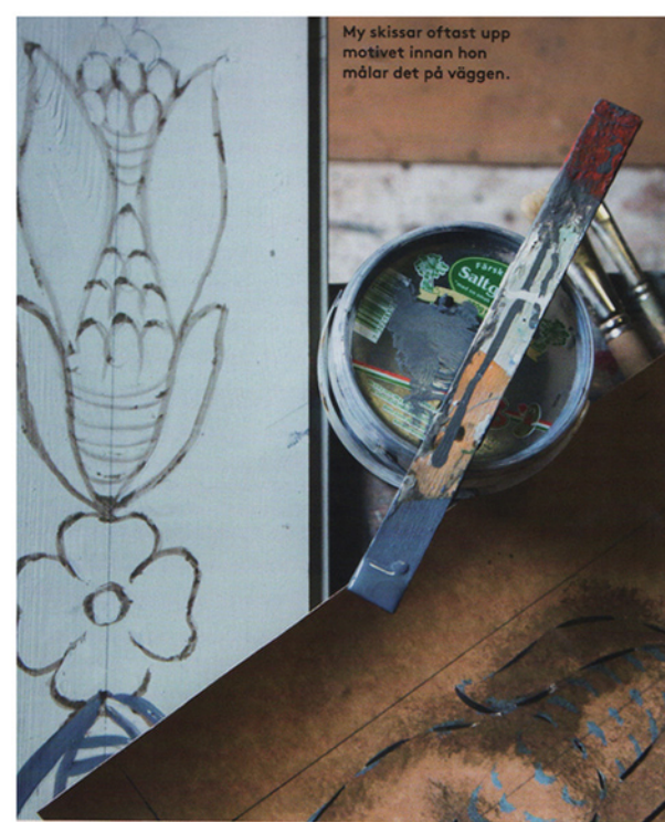
My skissar oftast upp motivet innan hon målar det på väggen.