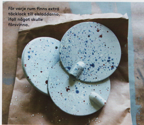
För varje rum finns extra täcklock till elsaddarna, ifall något skulle försvinna.