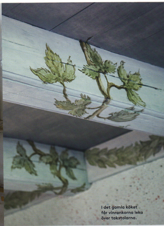
I det gamla köket får vinrankorna leka över takstolarna.